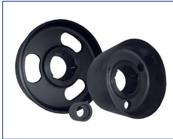
Flachscheiben in TL-Ausführung